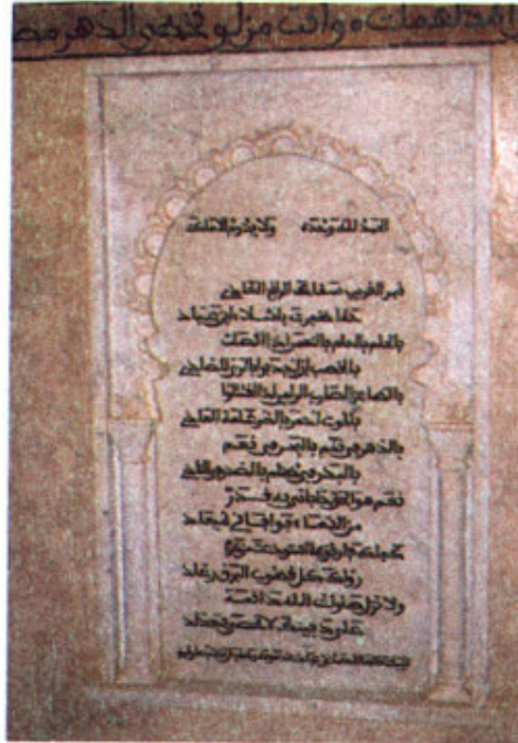
Poema-epitáfio de al-Mu'tamid no interior do mau- soléu.