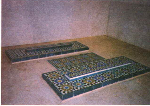
Em primeiro plano a campa de al-Mu'tamid, ao meio o de uma filha e ao fundo o de 'Itimad.