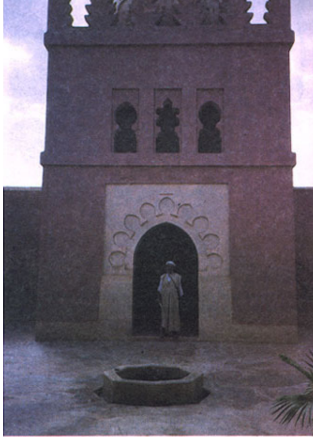
Portal de entrada do mausoléu de al-Mu'tamid, com o respectivo guardião.